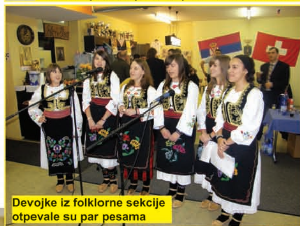
Devojke iz folklorne sekcije otpevale su par pesama