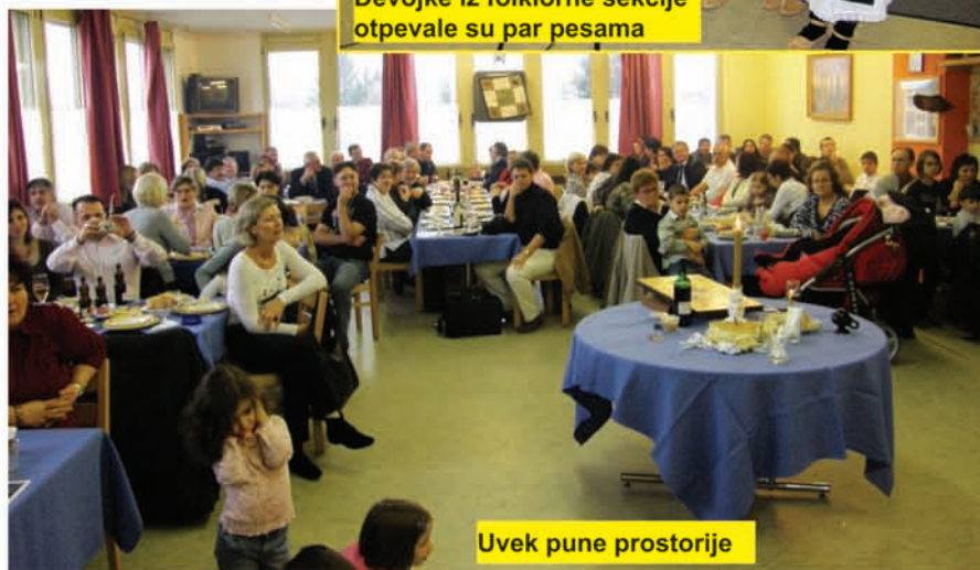
Uvek pune prostorije