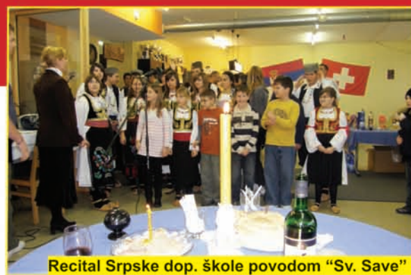
Recital Srpske dop. škole povodom "Sv. Save"